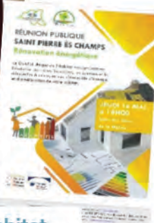
Réunion publique Guichet Unique Habitat