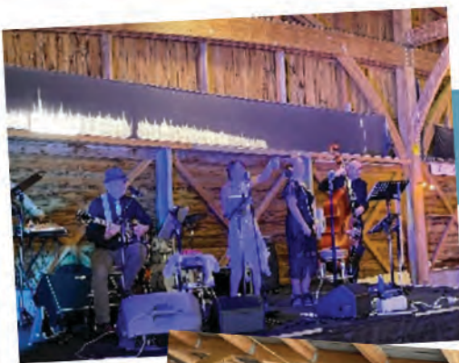
8 septembre, Après-midi guinguette (organisé par la CCPB)