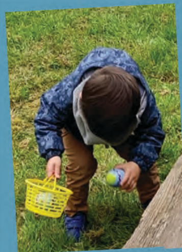
Pâques, 1 er avril chasse aux œufs.