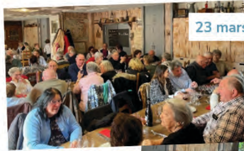
23 mars, repas des aînés.