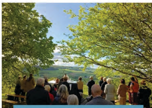
4 mai, procession sur la colline sainte Hélène