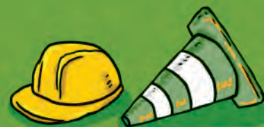
Compte Administratif 2023