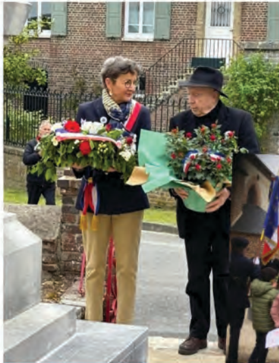
8 mai, commémoration au monument aux Morts