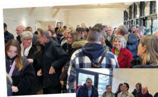
La cérémonie des vœux 2024