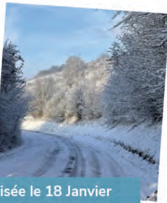
Une équipe mobilisée le 18 Janvier