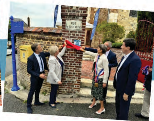
30 août, Inauguration des travaux de l'église et du monument aux morts